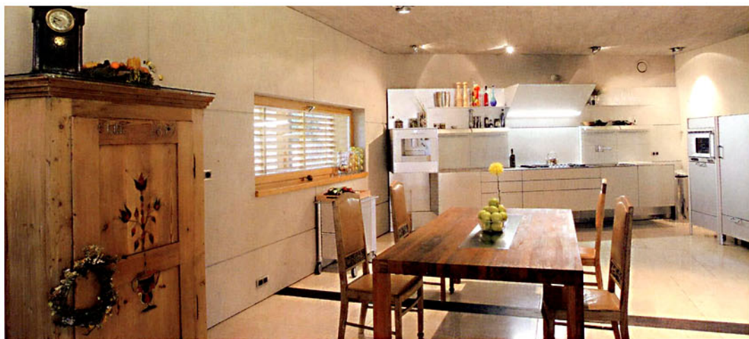
Firmas Bulthaup kustīgie moduļi un tikai pie sienas stiprināmās virtuves mēbeles ir gan funkcionālas, gan vizuāli vieglas, tās spēj sadzīvot arī ar senlaicīga stila mēbelēm.

Tā kā betona sienas bija paredzētas atstāt atklātas, tām bija jābūt ideālām. Visi sanitārtehnikas izvadi un elektrības instalācijas bija jāsaplāno jau iepriekš, jo tas viss tika iebetonēts sienās. Arī visas lampu iedobes tika atveidotas pirms betona liešanas, jau gatavā betonā nekas nav zāģēts. Zināmas korekcijas apgaismes sistēmā ļauj veikt izvēlēta programmējamā elektrosistēma, kas jebkuram slēdzim jebkurā brīdī ļauj piešķirt jebkuru lampu – ar vienu slēdzi var ieslēgt vai izslēgt visu mājas apgaismojumu vai tam pašam slēdzim likt izslēgt pirmā stāva, bet ieslēgt otrā stāva apgaismojumu.