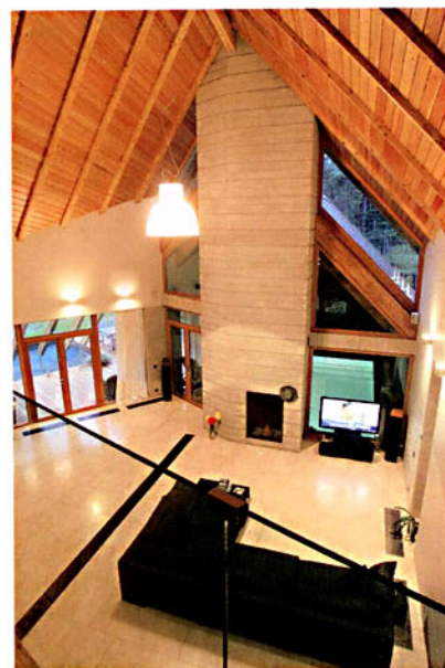
Mājas skaistākais skatpunkts – no otrā stāva balkona uz uguni kaminā, ūdeni baseinā un vakara sauli logos.